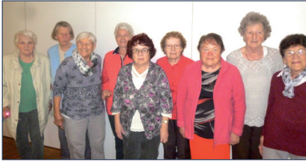
Der Kleine Kreis feiert im Dezember sein 40-jähriges Bestehen