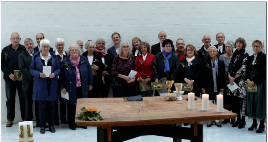
Ehrenkonfirmation in der Erlöserkirche mit Gästen aus Norddeutschland und den USA