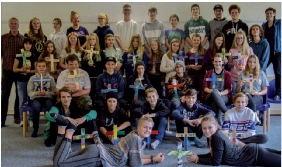
Konfifreizeit im Oktober