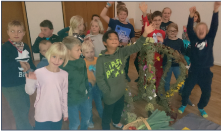
Die Kinder haben die Erntekrone geschmückt...