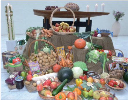
Erntedankfest - die Erntegaben wurden vom Caritas-Tafelladen in Immenstadt abgeholt und verteilt.