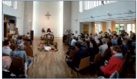
und alles ist für den Gottesdienst vorbereitet.