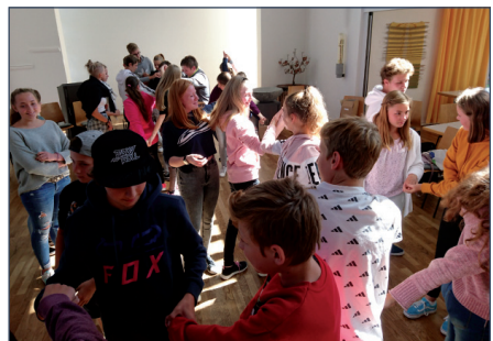
Erster Konftag - den gordischen Knoten zu lösen, kein Problem