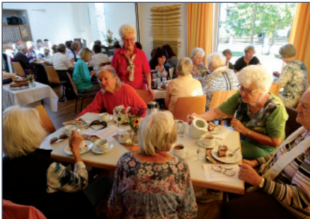
Fröhliche Feier - 50 Jahre Spätzle