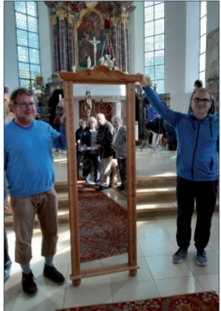
Der diesjährige Gottesdienst in der kath. Pfarrkirche St. Martin in Missen stand unter dem Thema „Spiegeln, Spiegeln an der Wand“